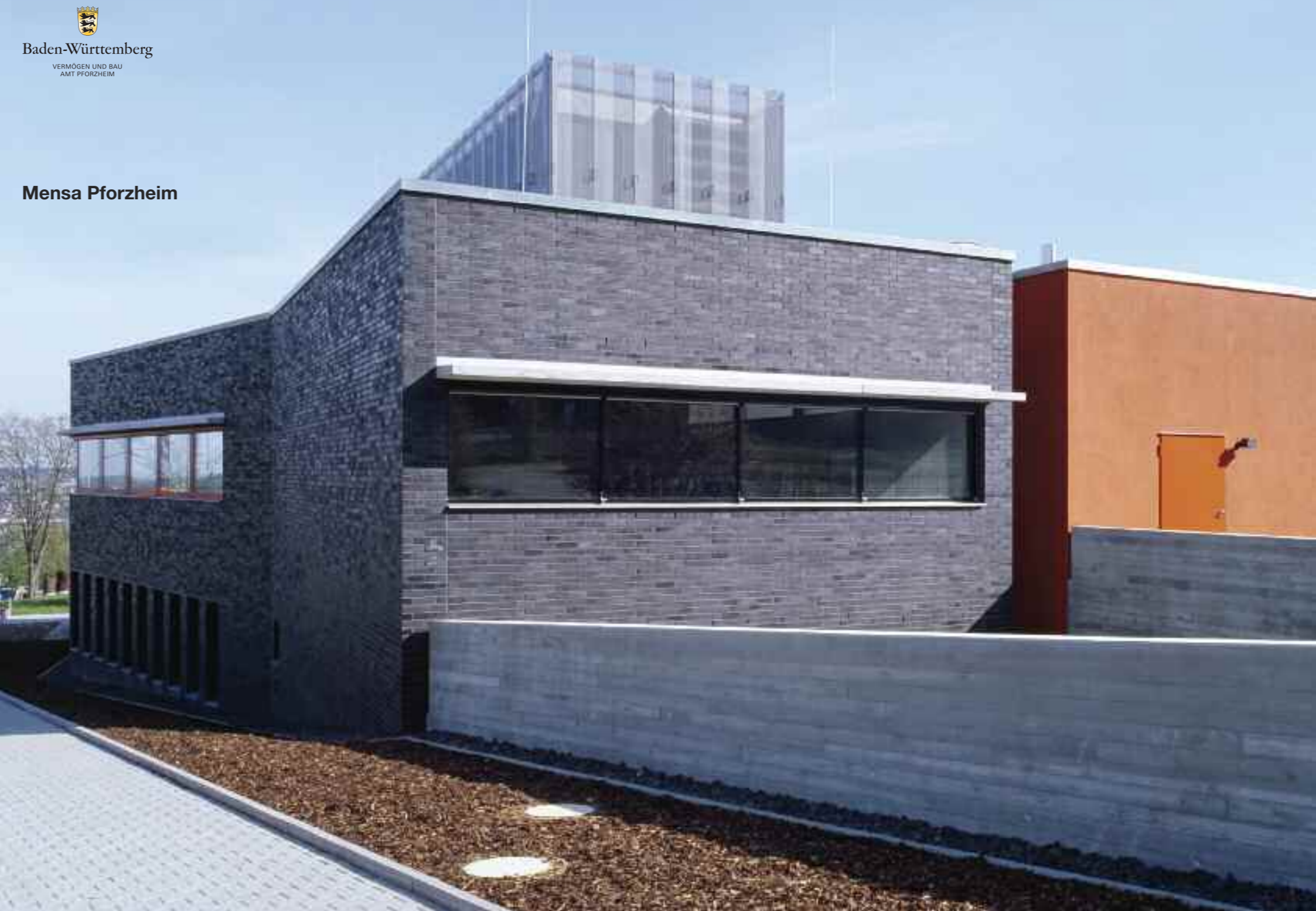
Baden-Württemberg VERMÖGEN UND BAU AMT PFORZHEIM Mensa Pforzheim

Mit freundlicher Unterstützung des Studentenwerks Karlsruhe