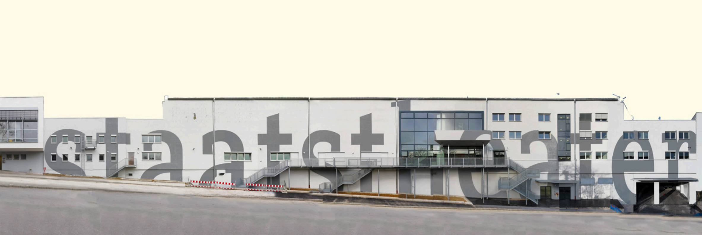
Probenzentrum und Studiobühne NORD Württembergische Staatstheater Stuttgart