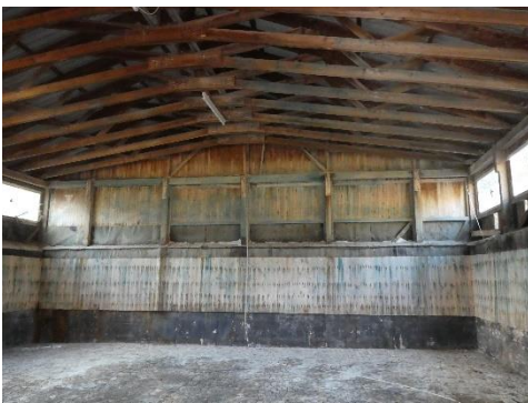
Halle von Innen