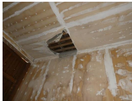
Undichte Stelle am Dach